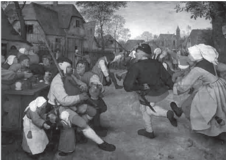
Pieter Bruegel, Ο Χορός των Χωρικών, 1568.

Μπορούμε να χρησιμοποιήσουμε τη γνώση αυτή για να γίνουμε δυνατώτεροι στη μάχη ενάντια στη συνεχιζόμενη καταπίεση και να τιμήσουμε τις γυναίκες αυτές που, στο παρελθόν, παρέμειναν δυνατές και αντεπιτέθηκαν, καθώς κι εκείνες που κάνουν το ίδιο στο παρόν και θα κάνουν το ίδιο στο μέλλον.