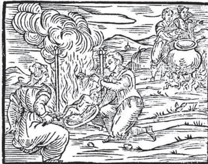
Μάγισσες που μαγειρεύουν παιδιά, Compendium maleficarum , 1608.

γεννήσεων. Σήμερα, η μη καταχώρηση μιας γέννησης είναι παράνομη σε όλη σχεδόν την Ευρώπη. Υπάρχει σημαντικός έλεγχος της αναπαραγωγής από τις αρχές, που κυμαίνεται από την απαγόρευση της αντισύλληψης και των αμβλώσεων έως τα κρατικά προγράμματα ελέγχου γεννήσεων στην Κίνα κι από την επιβεβλημένη στειρώση σε κάποιες βιομηχανικές ζώνες εξαγωγών, μέχρι την αμβλώση θηλυκών εμβρύων στην πατριαρχική κοινωνία της Ινδίας. Ο βαθμός ιατροκοποίησης της γέννας και η αντιμετώπισή της με όρους επικινδυνότητας, καθώς και η πίστη που έχουμε στις δυνάμεις των γιατρών και των νοσοκομείων που μοιάζουν μαγικές (παρά τη συχνή μας απογοήτευση από το ιατρικό κατεστημένο), αποτελούν ακόμη και σήμερα απόδειξη της μάχης αυτής. 25