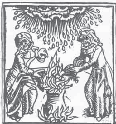
Μάγισσες που με ζόρκια προκαλούν βροχή, 1489.

«Η συνεργασία μεταξύ Εκκλησίας, Κράτους και ιατρικού επαγγέλματος γνώρισε την πλήρη της άνθιση με τις δίκες των μαγισσών. Ο γιατρός παρουσιάζοταν ως ο 'ειδήμων' της ιατρικής, προσδίδοντας μια επιστημονική αύρα στην όλη διαδικασία. Του ζητούσαν να κρίνει εάν κάποιες συγκεκριμένες γυναίκες ήταν μάγισσες και εάν κάποιες ασθένειες είχαν προκληθεί από μαγεία. Στο κυνήγι των μαγισσών, η Εκκλησία νομιμοποίησε ρητώς τον επαγγελματισμό των γιατρών, απορρίπτοντας τη μη-επαγγελματική θεραπεία ως αιρετική: 'Αν μια γυναίκα τολμήσει να θεραπεύσει χωρίς να έχει σπουδάσει, τότε είναι μάγισσα και πρέπει να πεθάνει'. Η διάκριση μεταξύ 'γυναικείας' δεισιδαιμονίας και 'ανδρικής' ιατρικής οριστικοποιήθηκε με τους ρόλους του γιατρού και της μάγισσας στις δίκες... Εκείνος τοποθετήθηκε στην πλευρά του Θεού και του Νόμου, ένας επαγγελματίας ίσης αξίας με τους δικηγόρους και τους θεολόγους, ενώ εκείνη τοποθετήθηκε στην πλευρά του σκότους, του κακού και της μαγείας. Ο γιατρός όφειλε το νέο του κύρος όχι στα ιατρικά ή τα επιστημονικά του επιτεύγματα, αλλά στην Εκκλησία και το Κράτος που τόσο καλά υπηρετούσε... Το κυνήγι των μαγισσών δεν εξάλειψε τις θεραπεύτριες των κατώτερων τάξεων, αλλά τις στιγματίσε για πάντα ως δεισιδαίμονες και πιθανώς κακόβουλες».