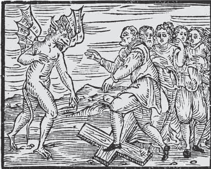
Ο διάβολος και οι μάγισσες ποδοπατούν ένα σταυρό. Από το εγχειρίδιο κυνηγών μαγισσών, Compendium maleficarum , 1608.

Οι δίκες και οι εκτελέσεις, στην αγχόνη ή στην πυρά, ήταν δημόσιες εκδηλώσεις όπου όλη η κοινότητα ήταν υποχρεωμένη να παραβρεθεί, συμπεριλαμβανομένων των θυγατέρων των μαγισσών, πράγμα στο οποίο δινόταν ορισμένες φορές ιδιαίτερη σημασία. Οι κυνηγοί των μαγισσών έφταναν στην πόλη μαζί με γιατρούς, κρατικούς υπαλλήλους, μέλη του κλήρου και δήμιους. Όλοι οι κάτοικοι έπρεπε να πάνε στην πλατεία για να παρακολουθήσουν το θέαμα της δίκης, μια μεγάλη εκδήλωση με αποκορύφωμα τις εκτελέσεις. Αν κάποιος δεν παρευρισκόταν στην «εκδήλωση» ή αν, ακόμα χειρότερα, μιλούσε εναντίον της δίκης ή υπερασπιζόταν κάποια κατηγορούμενη θεωρούνταν αμέσως ότι αποδεχόταν την ενοχή του και η ζωή του έμπαινε σε κίνδυνο. Ο αυξανόμενος φόβος δεν μπορεί να θεωρηθεί υπερβολικός αν σκεφτεί κανείς ότι για δεκάδες χρόνια καίγονταν τακτικά πλήθη γυναικών. Οι άνθρωποι αυτοί ήταν γείτονες, φίλοι και συγγενείς. Τα περιστατικά γειτόνων που κατηγορούσαν ο ένας τον άλλο δεν ήταν παρά αντίδραση απέναντι στο φόβο που γεννούσαν αυτές οι επαναλαμβανόμενες δημόσιες δίκες και εκτελέσεις. Αυτή είναι μια διαφορετική ανάγνωση της ιστορίας σε σχέση με την εξήγηση περί «μανίας κατά των μαγισσών» ή περί «μαζικής ψύχωσης» που δίνεται συχνά στην επίσημη ιστορία. Στη συνέχεια εξετάζονται κάποιες από τις αιτίες και τις συνέπειες του κυνηγιού των μαγισσών.