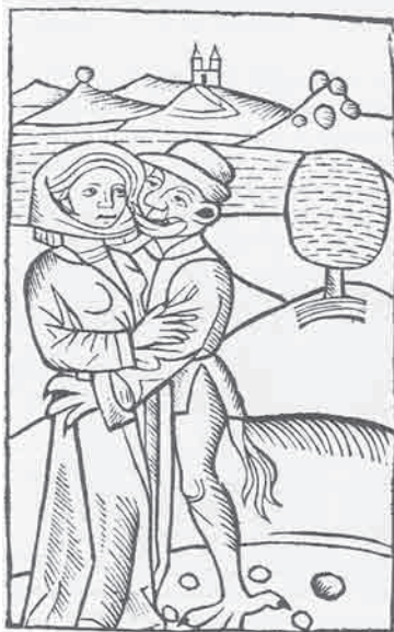
Ο διάβολος αποπλανεί μια γυναίκα, 1489.

Μερικά από τα πιο αλλόκοτα πράγματα που έχουν γραφτεί για τη γυναικεία σεξουαλικότητα υπάρχουν στο Malleus Maleficarum , στο οποίο περιλαμβάνονται αποσπάσματα όπως: «Τι να πει κανείς για αυτές τις μάγισσες που μαζεύουν μεγάλες ποσότητες ανδρικών οργάνων και τα βάζουν στη φωλιά ενός πουλιού ή τα κλείνουν σε κάποιο κουτί όπου αυτά κινούνται μόνα τους σαν ζωντανά μέλη και τρώνε βρώμη και καλαμπόκι, κάτι που πολλοί έχουν δει και είναι συχνό θέμα μαρτυριών;» Ή «Πηγή της μαγείας είναι η σαρκική επιθυμία, που στις γυναίκες είναι ακόρεστη». 15