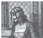
"Στρίγγλα" με χαλινάρι, 1885.

Αναφερόμενη τόσο στον τρόπο που οι αρχές ενθάρρυναν τον αποκλεισμό των γυναικών από τη μισθωτή εργασία όσο και στην οικιακή χειροτεχνική και βιοτεχνική εργασία που έκαναν πράγματι οι γυναίκες, η Silvia Federici εξηγεί: «Αυτή η συμμαχία μεταξύ των συντεχνιών και των αρχών των πόλεων, καθώς και η διαρκής ιδιωτικοποίηση της γης ήταν που επέβαλαν ένα νέο έμφυλο καταμερισμό της εργασίας, ορίζοντας τις γυναίκες ως μητέρες, συζύγους, κόρες, χήρες –όροι που απέκρυπταν την ιδιότητά τους ως εργάτριες– ενώ συγχρόνως έδινε στους άνδρες ελεύθερη πρόσβαση στο σώμα και την εργασία των γυναικών καθώς και στο σώμα και την εργασία των παιδιών τους». 13 Η Silvia Federici ισχυρίζεται ότι ο καταμερισμός της εργασίας βάσει του φύλου ήταν μια σχέση εξουσίας που αποτέλεσε τον ακρογωνιαίο λίθο της διαδικασίας της πρωταρχικής συσσώρευσης και της ανάπτυξης του καπιταλισμού. Το κунήγι των μαγισσών υπήρξε αρωγός της πολιτιστικής και οικονομικής καταπίεσης με τη διαρκή απειλή της εκτέλεσης όσων δε συμμορφώνονταν.